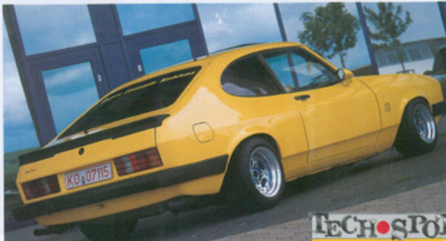
Von wegen "Bad Banane" - nach einem Crash zeigt sich die Karosserie wieder in Top-Form