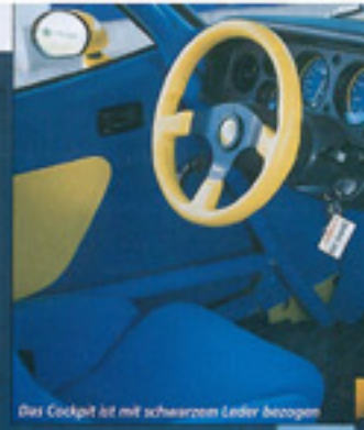
Das Cockpit ist mit schwarzem Leder bezogen