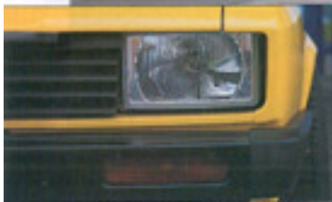
Rechteck-Scheinwerfer verleihen dem Ford den "bösen Blick"

stellbar, VZA-Domstrebe, Hinterachse: Einblattfeder, HD-Gummis, höhenverstellbare Federn am Dämpfer, Domstrebe • Bremsen: innenbelüftete Scheiben vorne mit Granada-Sätteln, Granada-Bremskraftverstärker • Räder/Reifen: dreiteilige PLS-Felgen 9 x 13 ET 10 mit 215/50 VR 13 • Karosserie: Kabelbaum im Motorraum unsichtbar verlegt, Unterboden versiegelt und blau lackiert, Batterie im Kofferraum, Frontscheibe mit Keil, Glas-Austrittsdach • Interieur: blaue Vollschalenitze, blau-gelbe Verkleidungen, Armaturenbrett lederverkleidet, blaue Instrumente, 32er Momo, Überrollkäfig mit Flankenschutz, Hosenträgergurte