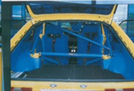
Ein kompletter Käfig schützt den Fall der Felle