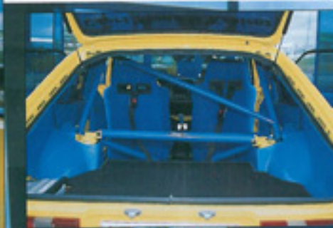
Ein kompletter Käfig schützt den Fall der Felle